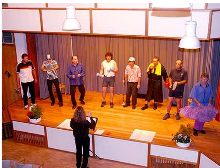
Seine musikalische Visitenkarte gab der Durmersheimer "Hardtchor" beim Kulturring Waldbronn im Kulturtreff ab